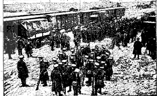
De ontrenting van de Keulse zone, welke zonder vertoefplaats had. Van de afgeleide goedereinstellingen verlieten de Engelsche troepen in kleine afdeelingen de stad.