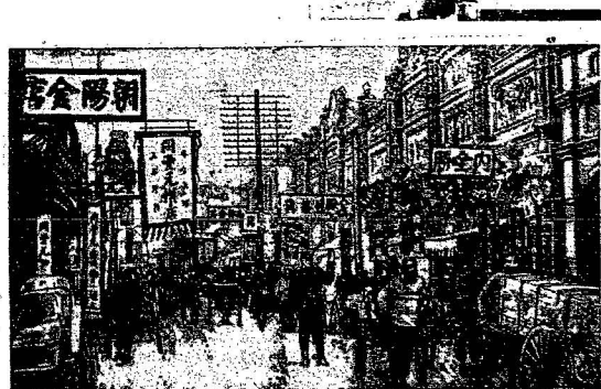
De burgeroorlog in China. Moerden de hoofdstad van Tschang Tso Lin.