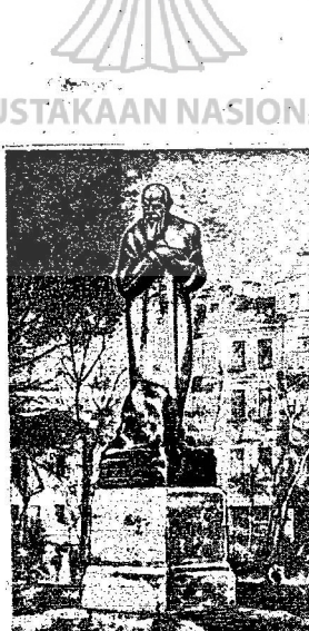
Het Dostojewski-monument, van Merkurow, dat na de revolutie in Rusland werd opgericht. Het stelt Dostojewski als tuchthuisgevangene voor.